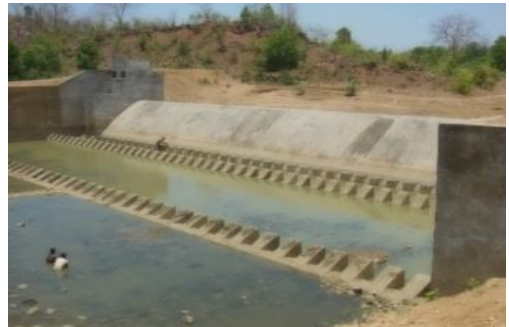
gúKúj òl Ì ସେତ ପ୍ରକଳ୍ପର ସମ୍ପୂର୍ଣ୍ଣ ହୋଇଥିବା ହେତୁ ଓ୍ଵାକୁ

^hòj ù~ a 105.909 ùj Kē Rcò@]Mj Y ^cù« bicò @]Mj Y @]KieúVúe 4.82 ùKúUò Uuú Rcú Ke[úF (ciyò 2012) GZ\páZúZ _KÌ ^cù« 65.211 ùj Kē Rwf Rcè @]Mj Y ଏବଂ ଜଳମଗ୍ନ ଅଞ୍ଚଳ ଅଧୀନରେ ଆସୁଥିବା 39 Uò _eàtee _ē^ad ū^ KeàúKè [f̄ü ö @ÿ, ù\Lfè ù~, abúM ^icúe Rcò ହସ୍ତାନ୍ତର ଅଥବା ଜଙ୍ଗଲ ଜମିର ପରିବର୍ତ୍ତନ j ùi f ùj úA_úe^ [f̄ü (Wjii ´e 2012) ù