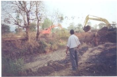
CZL^^KieU\beuKe e0^kie L^^ Ku~y

i cul ueeGj u u\LuMfu 6a, 6a XIII eeXVII @]o ue 53.37 uKilUoUuuie c-e 68Uo _KI cpee 13Uue (ZoWo Rk^Kii abir^14) ^hoj u~ au /@ul Y ~a/cLy~ au cuu^ ^Ycu/Rk^Kii _Yiku MvKe Wj@iepe (@UKk MvKue) cilUo uLiku Kic jE \beu KeauKe auQ[uF ~ij ue j ue N^cUe _Zo 35.80 Uuee 68.41 Uui cpeue [fu o a; Z cifyue (jE \beu L^^) Ku~yMvKe uUSe uj uA [fu o ~\P ^ficWjK am^o^i ue uUSee u~uMy uj auKeKu~ye ^hoj ^cu« @iagyKid ~a_uZo(CZL^^KieU)e C_f^2 GK cir^S [fu, Ku~yMvKe @uFuK PZue \g0-uA [hu _e0 ~a_uZo cZd^ Ke0(NUZ cifyue) 2008 ee2012 cpeue ^hoj Kei~huie `kEei_ 6.96 uKilUoUui @]K _hu^ uj fu Ga0 u~Cf[ee5.80 uKilUoUui VKi\ieci^u ^KUKe G[cpeue ~uAi ue[fu