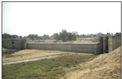
PKúik I Ì ସେତ ପ୍ରକଳ୍ପର ସମ୍ପୂର୍ଣ୍ଣ ହୋଇଥିବା ହେତୁ ଓ୍ଵାକୁ

^iàúMj\úeú 335.15 ùKúUòUuúe c-è ùj úA[èú 271Uòl àRkúii P^ _KÌ c ² eè @ÿ, ù\Lfè [f̄ü ù~, 2011-12 i q̄ ù ^q̄ òeZ [èú 11783 ùj Kē PihRcKè ùi P^ ù~úMúAaúKè73.90 ùKúUòUuúe ମଞ୍ଚର (ଘାଞ୍ଚ-XIII, 2007-08 Gaò XIV- 2008-09) 51Uò _KÌ ùe ùKak ùj Wj̄ ÒKò Kú~j̄MúVKe 50.04 ùKúUò Uuú ବ୍ୟୟରେ ସମ୍ପୂର୍ଣ୍ଣ ùj úA [f̄ü ù bicò @]Mj Y ùj úA^ [èú ù~úMá(30Uò_KÌ), abúR^ _Yúku MúVKe @úduKUp ù~úR^ú PWj̄«KeY ùj úA^ [èúeè (15Uò_KÌ) ùUŠe PWj̄«KeYúe ak´ (ZòUò_KÌ) I Kú~j̄ _àú^ùe ak´ (ZòUò_KÌ) ù~úMá abúR^ _YúkuMúVKe Kú~j̄ ciyò2012 _~j̄« @ie, ùj úA^ [f̄ü, ` kÉe_ ad ù~úM ùj A[èú 50.04 ùKúUòUuú ùKòYi ò` k C_RúA^ [f̄ü ö