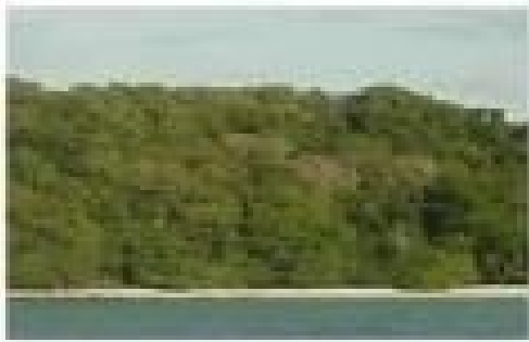
ଅତି ଘଷ ଜଙ୍ଗଲ

eūĀid a^ @ūdūM ciyō 2006 ūe i ē_ēg Kūf ū~ Rwf Gaō a^y_āYū ସମ୍ପର୍କର ପୋଷଣାୟ ପରିଗୁଳନା ନିମିତ୍ତ ନିଜସ୍ୱ Rwf ^iZō _Zō eūRý Keūaō Gjō ^iZōe, @^yū^y ahd c]yūe, e j ū~ūA [ŕū _ēKēK Rwf e i ūel Y, Rwf e a j Z ū_ūhY, _KūS a^ūKeY \ŕeū @iZū\ŕ ଗଛ ଅଞ୍ଚଳ, ସାମାଜିକ a^aŷyū Kū~ŷKūc Gaō CūYgy _eY