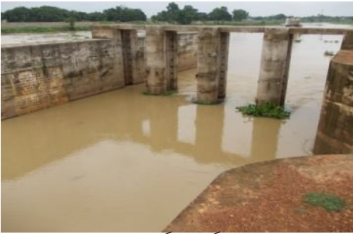
ଅସଫଳ ହେଉ ଥିଲା

2665 ūj Kē eaò` i f RcKēūi P^ ū~ūMūAaū ^cū« _ē_ eēē_ v @]ŕ^ ūe c-ēū_ŕ (1999-2000) ପ୍ରକଳ୍ପଟି ଅସଫଳ būa Rī^ēūēi/ūc 2004 Vīēē QūWj \ŕēūMfū । କାର୍ଯ୍ୟଗୁଡ଼ିକର ଅବଶିଷ୍ଟାଣ ଗ୍ରାଞ୍ଚ XIV @]ŕ^ ūe _ē_ ū C_i ū_ ^ KeūMfū Gaō 2011-12 i ū ū ūi cū^ue i cū_ò ^cū« ^iaūWj 17.75 ūKūUò Uūū c-ē Kfū (Rī^ēūēi 2009) ū