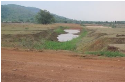
ଅସମ୍ପୂର୍ଣ୍ଣ ହେଉ ଓଡ଼ିଶା

I cūl ūēē ù\LūMfū ù~, RkbŠie _eñ; ùj aūe ^q ūēZ ZūēLe Q@cūi _jāēē _KĪ _būāZ 21Uò Māce _ē^aō Zō ଯୋଜନା ସମ୍ପର୍କୀ ଭାବରେ କାର୍ଯ୍ୟାନ୍ୱିତ Keñū ^cū« _eūag I Rwf c^Yūkd (Gc| AG` ) ù\A[ñū _Éūā (^ūb´e 1990) c^eē ùKak Q@Uò Māce 469 Uò _eñūē _ē^aō ū^ Ke[ūf । ପରବର୍ତ୍ତୀ ସମୟରେ ଓଡ଼ିଶା କୃଷି I ùahdK aḡñāyūkd _būāZ Māc MŵKūe i ūciRK, @[ū^ZK I i ūĀZK i ùaō Y (2006) Keḡ 1220Uò _eñūē _ē^ū aù;ūāÉ Gaō [A[ū^ i j ūdZū ^cū« ù~ūMý ùaifō ^q ūēY Ke[ūf ö Gjò _ē^aō ū^ ahdUoi cū]Z ùj ūA^[ūf] ଏବଂ ଗ୍ରାଞ୍ଚ X @]ūē ùj ūA[ñū c-ēū cūyō 2010ūē PḡZō NUfūō 113.04 ùKūUòUūū aýd (G_ūf 2012) ସତ୍ତ୍ୱେ ପ୍ରକଳ୍ପଟି ଅସମ୍ପୂର୍ଣ୍ଣ [ūfū Gaō ùj Wḡ I KĪē Kū~ḡ^ñj ^cū« ùKōYi ö ଟେଣର ବଳବତ୍ତର ନଥିଲା ö @ūfūK PZūē \ḡñ-ūA[ñū _eò ùj Wḡ I KĪē Kū~ḡUò @ūḡK būā i ḡ%ñj ūA[ūfū ö