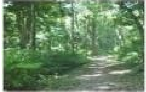
Cମମ ଘଞ୍ଚ ଜଙ୍ଗଲ

କରିବା ପାଇଁ ଲୋକମାନଙ୍କର ସମ୍ପୂର୍ଣ୍ଣ ଇତ୍ୟାସି @«bòj ù ~ùj ùj C ù\LùMFù ù~, ଉପରୋକ୍ତ ସୁପାରିଶର ପାଞ୍ଚ ବର୍ଷ ପରେ ମଧ୍ୟ eùRý i eKùe Wùì ´e 2012 i q u Gjíe ^RÉ Rwf ^ùZò^q ùeY Keò^ùj ù«ò